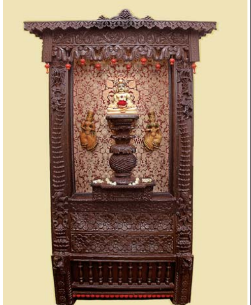
एकोपासना फलवती बलवती च